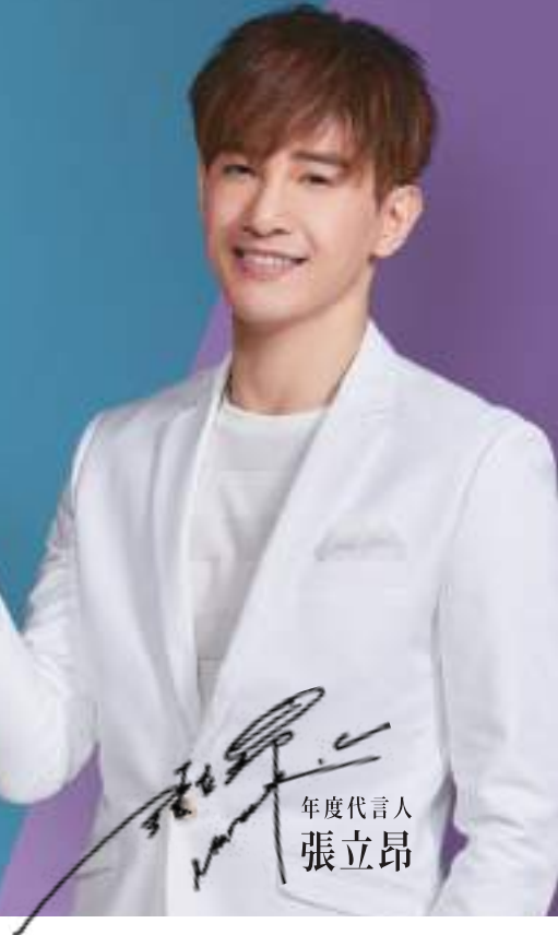
年度代言人 張立昂